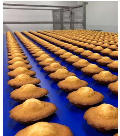
Nos Madeleines sur le tapis de refroidissement après la cuisson.

produits. La mise en boîte de nos madeleines est elle aussi réalisée de façon manuelle afin de contrôler chacune de nos madeleines pendant la mise en boîte. La qualité de nos produits fait partie de notre ADN, c'est ici le moyen de s'assurer de la conformité de nos produits.