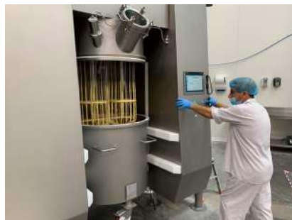
Notre batteur peut battre jusqu'à 200kg de pâte par session.

produits. La mise en boîte de nos madeleines est elle aussi réalisée de façon manuelle afin de contrôler chacune de nos madeleines pendant la mise en boîte. La qualité de nos produits fait partie de notre ADN, c'est ici le moyen de s'assurer de la conformité de nos produits.