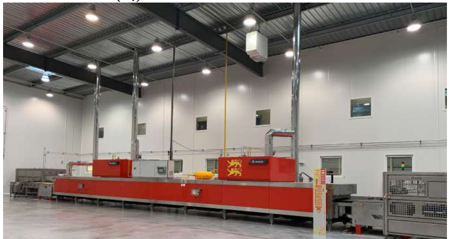
Notre four, d'une longueur de 16m de long. Il est composé de deux zones de chauffe.

Une fois démoulées, les madeleines sont emballées en sachets individuels afin de garantir l'hygiène et la fraîcheur de nos